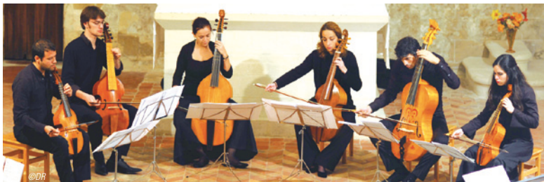
Le premier enregistrement de L'Achéron consacré à Anthony Holborne, paraîtra en 2014 sous le label Ricercar.

L'Achéron est composé d'une jeune génération de musiciens s'attachant à interpréter les répertoires anciens, en mettant en valeur les essences qui les caractérisent, dans un souci d'authenticité et de respect des œuvres et des instruments originaux, mais aussi dans un esprit de lisibilité pour le public actuel. Les recherches musicologique et organologique ainsi que la compréhension du message artistique s'associent pour nourrir les curiosités intellectuelles, sensibles et spirituelles du public.